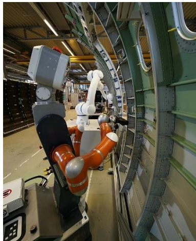
Abb. 3 Die Architektur von SWAP-IT ist für viele verschiedene Branchen anwendbar, beispielsweise auch im Flugzeugbau. Auf der Hannover Messe präsentieren die Fraunhofer-Forschenden eine Reihe praxisnaher Demos.