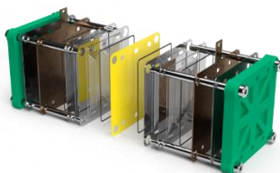
Abb. 1 Viele Komponenten in Brennstoffzellen sind wiederverwendbar oder wiederverwertbar – wenn die Brennstoffzelle dafür konzipiert wurde und automatisierte Demontageprozesse verfügbar sind